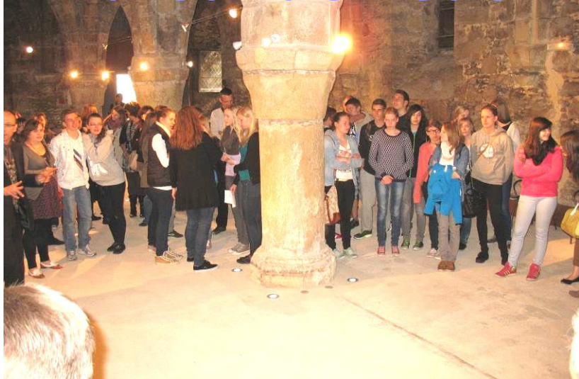
Collégiens français et allemands à Epernon – mai 2013