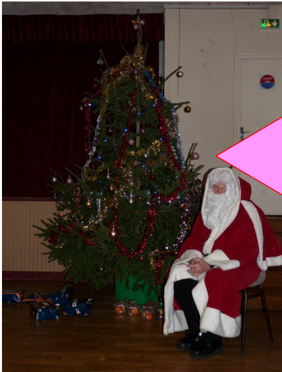
Le Père à Noël pour les moins de 3 ans 7 décembre