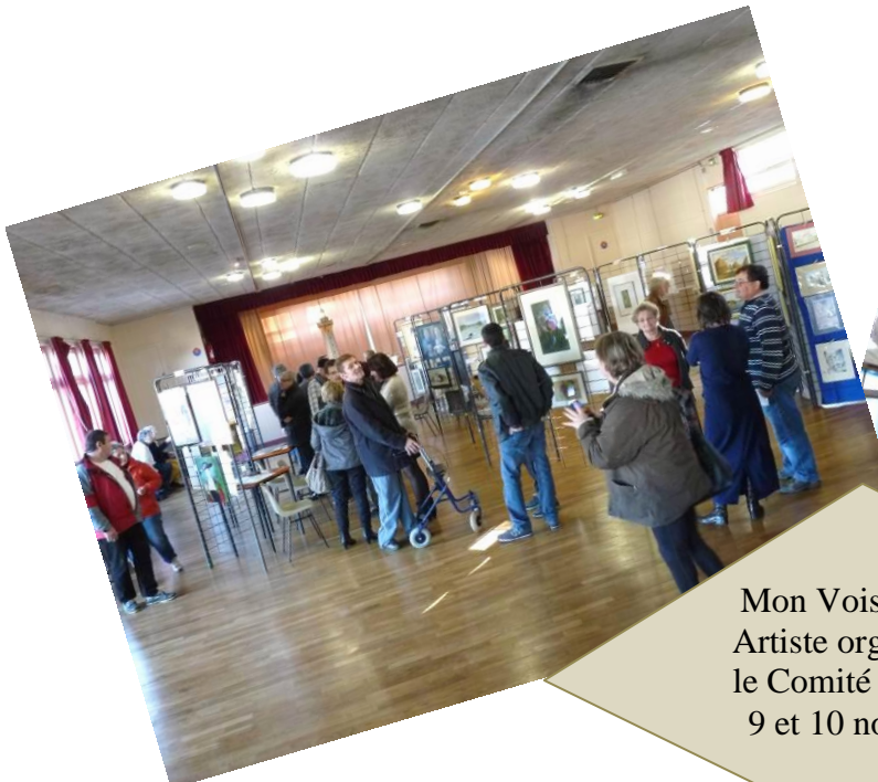
Mon Voisin est un Artiste organisé par le Comité des Fêtes 9 et 10 novembre