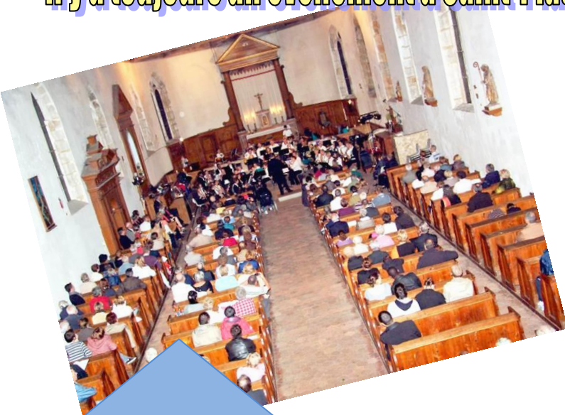
Concert donné à l'église organisé par le Comité des Fêtes 28 septembre