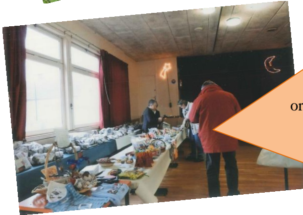
Marché de Noël organisé par Paroisse Saint-Piat / Jouy 17 novembre