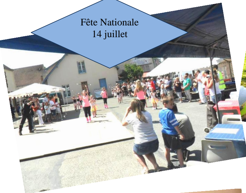
Fête Nationale 14 juillet