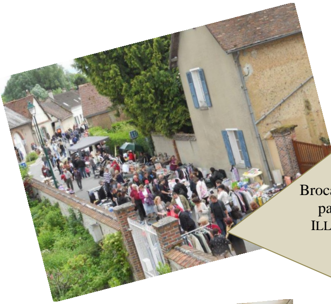
Brocante organisé par les Amis ILLSCHWANG 24 juin