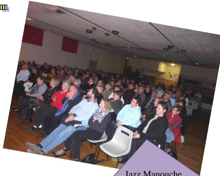
Jazz Manouche organisé par le Comité des Fêtes 8 novembre