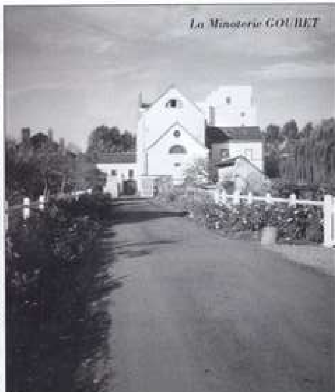
La Minoterie GOUBET

Les camions transportent chaque jour «La favorite» du joli nom de M me de Maintenon, favorite de LOUIS XIV, c'est à dire la gamme des farines (boulangère, pâtisseries, de grain, complète, de seigle, campagnarde...) La minoterie GOUBET fournit surtout