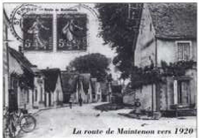
La route de Maintenon vers 1920