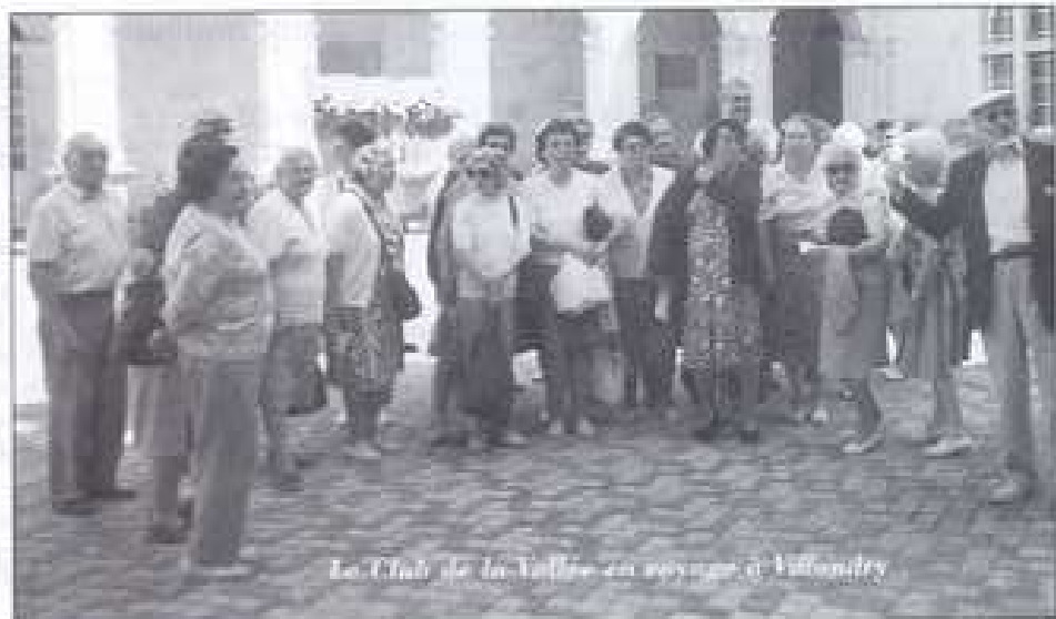
Le Club de la Vallée en voyage à Villandry