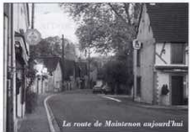
La route de Maintenon aujourd'hui