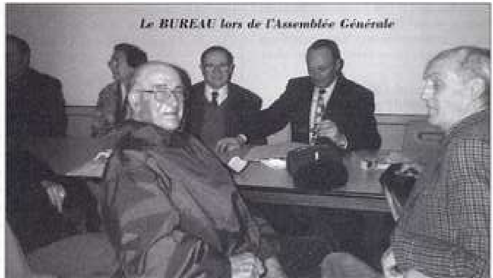
Le BUREAU lors de l'Assemblée Générale

La cérémonie du 8 Mai s'est déroulée, dans le recueillement, à la mémoire des victimes