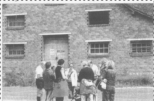
DIMANCHE, À SAINT-PIAT. Les 120 visiteurs ont été répartis en sept groupes, tel celui-ci qui découvre l'ancienne briqueterie Lambert.

Le 19 juillet dernier Saint-Piat a accueilli près de 120 personnes venues de tout le département et plus largement de toute la Beauce, répondant à l'invitation « Terre de Beauce » et de la Municipalité de Saint-Piat. La jeune « Association pour la valorisation du patrimoine et de l'histoire de Saint-Piat et de ses hameaux » avait été chargée par la Municipalité de préparer et d'organiser cette manifestation : un parcours à travers Saint-Piat, une exposition dans la Salle des Fêtes, une petite brochure distribuée aux participants (à raison d'une par famille).