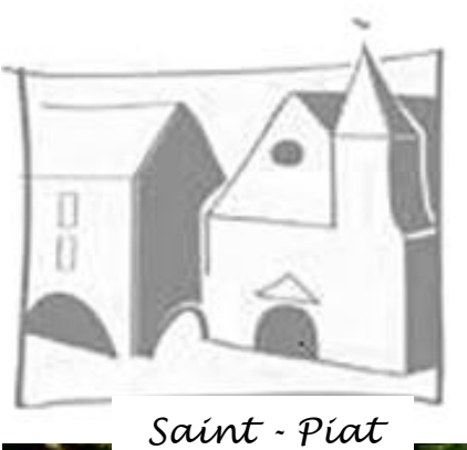
Saint - Piat