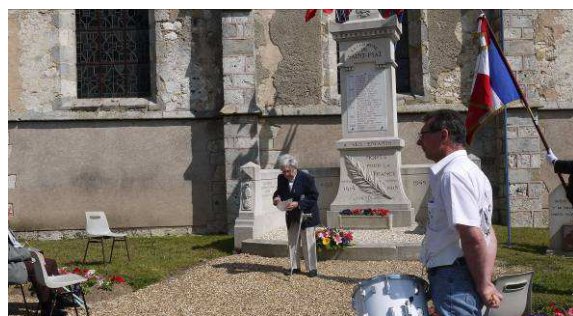
Commémoration du 8 mai 1945