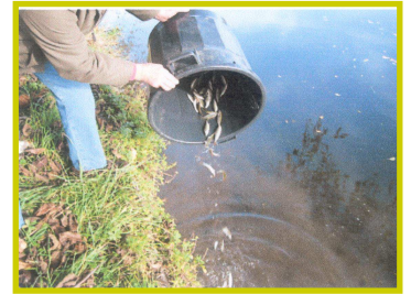
Alevinage sur le parcours Saint-Prest, Jouy et Saint-Piat en novembre 2011