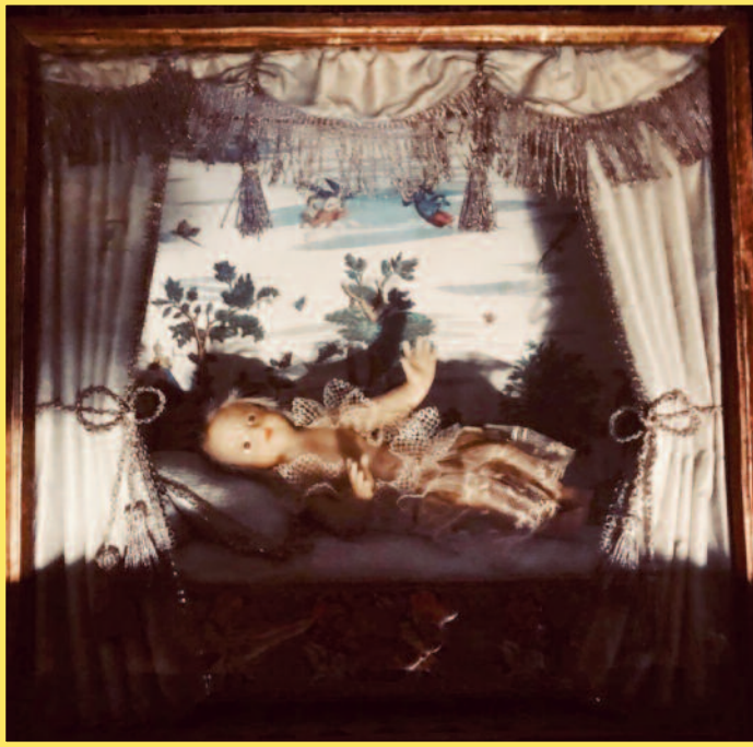
Pour le futur petit musée du château à présenter au public : «Le petit roi de Grâce» : Louis XIV en enfant Jésus. Provient des auspices de Beaune, époque Louis XV, v 1750. Poupée de cire et boîte en Arte Povera

Pour l'anecdote, d'importants et nombreux pavés de cette cour carrée ont été retrouvés il y a peu suite à des travaux pour l'aménagement de la clinique vétérinaire. Concernant la chapelle, quatre petites pièces se distinguent clairement au sol dont certaines qui devaient faire office d'antichambre ou le matériel et les vêtements liturgiques nécessaires aux offices étaient entreposés. L'absence de sondage ne permet pas de fouiller plus avant ces investigations mais les traces d'un bâtiment oblong qui prolonge le bâtiment, vient « mourir » à l'angle Nord-Ouest du domaine.