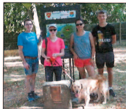
Malgré ces annulations, un famille d'Illschwang en vacances à Saint-Piat cet été