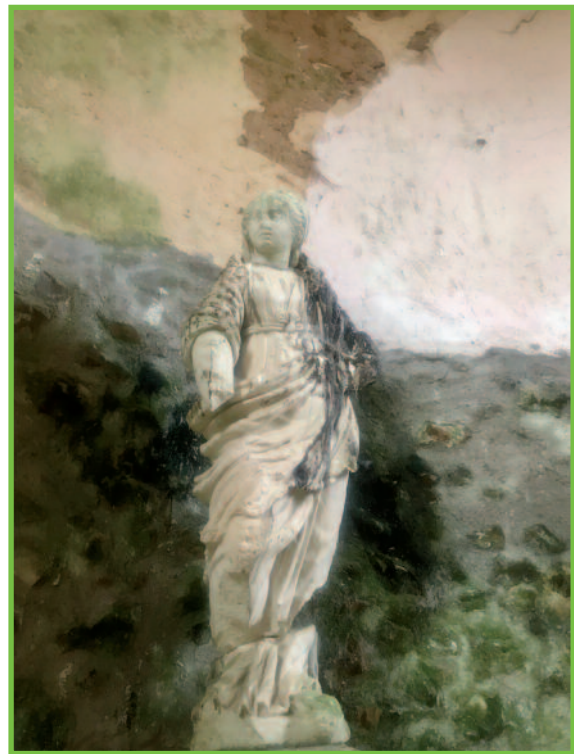
Statue de la Vierge Marie retrouvée dans le mur d'une douve du château, fin du XVI e - début XVII e