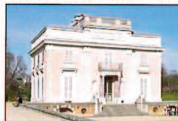
Le château de Bagatelle au Bois de Boulogne

Devant toutes ces annulations et afin de maintenir une activité au sein de notre Comité de jumelage, notre conseil d'administration avait décidé d'organiser pour nos adhérents une sortie à Paris à l'automne, avec au programme la visite du palais du Luxembourg (Sénat), construit en 1620 par Marie de Médicis et celle du château de Bagatelle, ou « Folie du Comte d'Artois », construit en 1777.