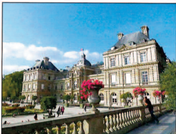
Le palais du Luxembourg, côté jardins