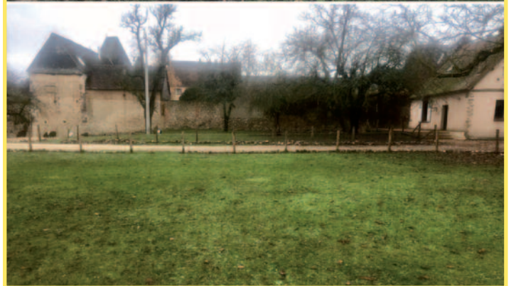
Les traces supposées de l'emplacement de l'ancienne chapelle/oratoire du château (les 2 photos collées l'une sur l'autre)

façon moins anecdotique et pour servir à une histoire économique et culturelle de terres si proche de Paris et de Versailles, y a-t-il eu transfert (vente, legs, dons...) des biens meubles et des terres d'Église entre ces deux territoires, que des cartulaires anciens pourraient référer ? Autant d'éléments qui prouvent, s'il n'en faut, que l'histoire locale s'intègre dans une étude plus vaste d'enjeux de « pouvoir » et de puissance.