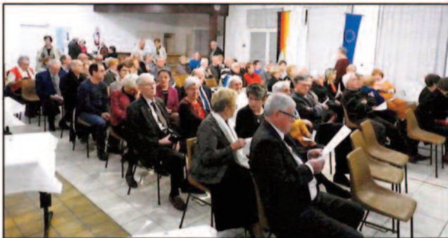
L'assistance lors de l'Assemblée générale