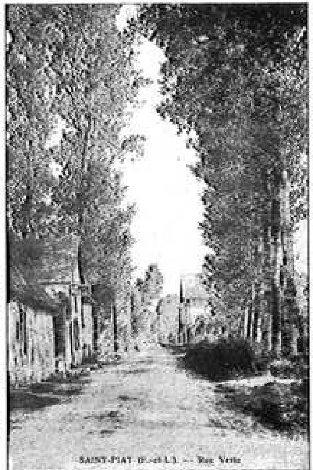
SAINT-PIAT (D.-H.L.) - Rue Verte