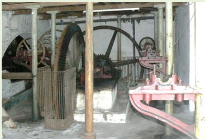
Vue de la chaîne des engrenages qui transmettent le mouvement de la grande roue aux machines de meunerie réparties dans les étages.

Les nombreuses questions des visiteurs ont montré tout l'intérêt qu'ils portent à ce qui touche à la meunerie et au patrimoine.